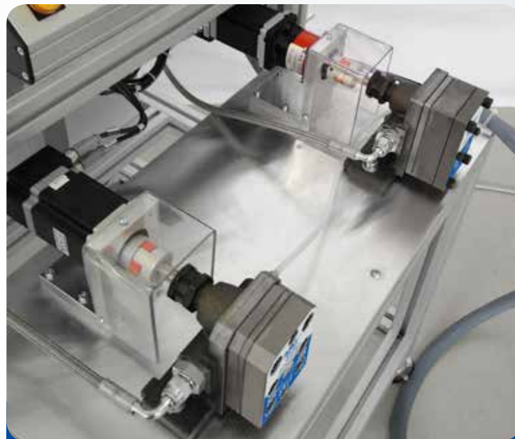
Resinatura volumetrica bicomponente 2K resin volumetric dispensing