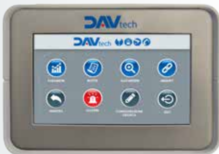
Menù generale | General menù