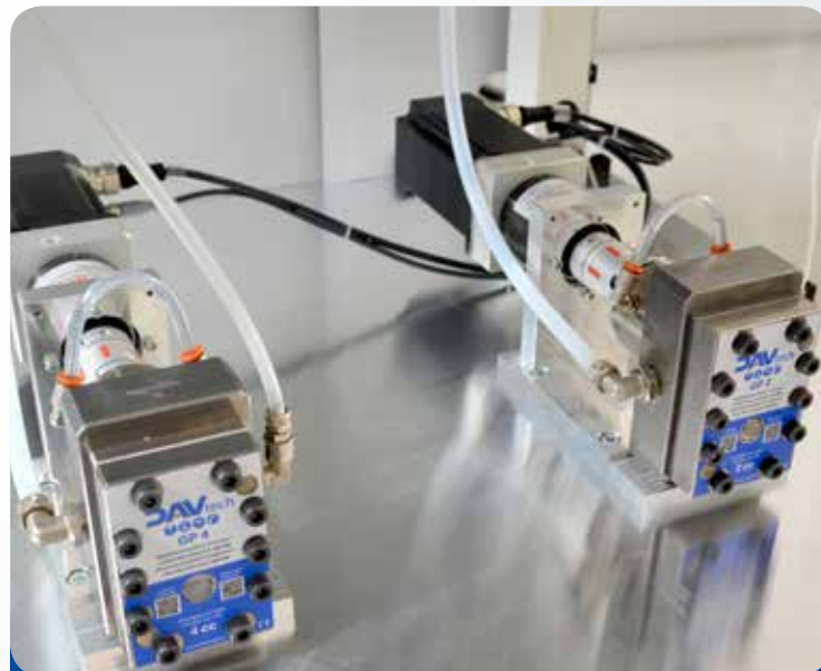
Resinatura volumetrica bicomponente 2K resin volumetric dispensing