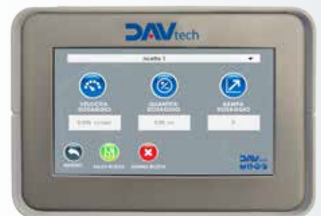
Modalità tempo | Time mode

La gestione della pompa GP è il vero punto forte della nostra soluzione tecnica.