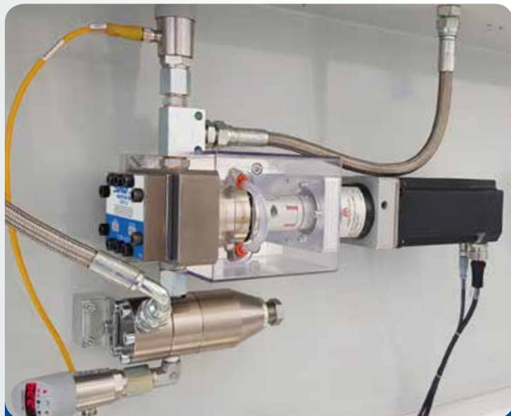
Dosatura volumetrica sigillante silicico Silicone volumetric dispensing