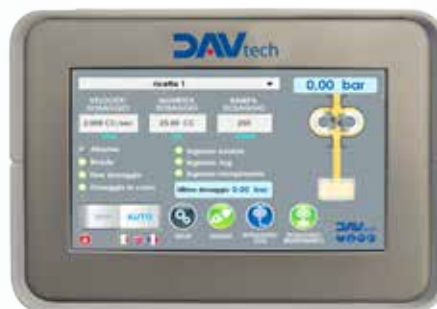
Modalità riempimento | Filling mode