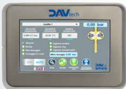
Modalità in Jog | Jog mode