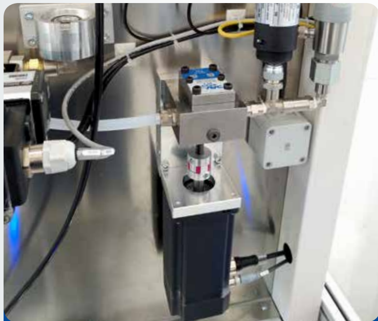
Dosatura volumetrica guarnizione liquida Liquid gasket volumetric dispensing